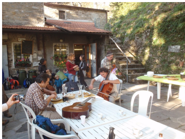
VACANZE AL FORTE

Comune Forte dei Marmi : piazza Dante, 1 Tel 0584-2801